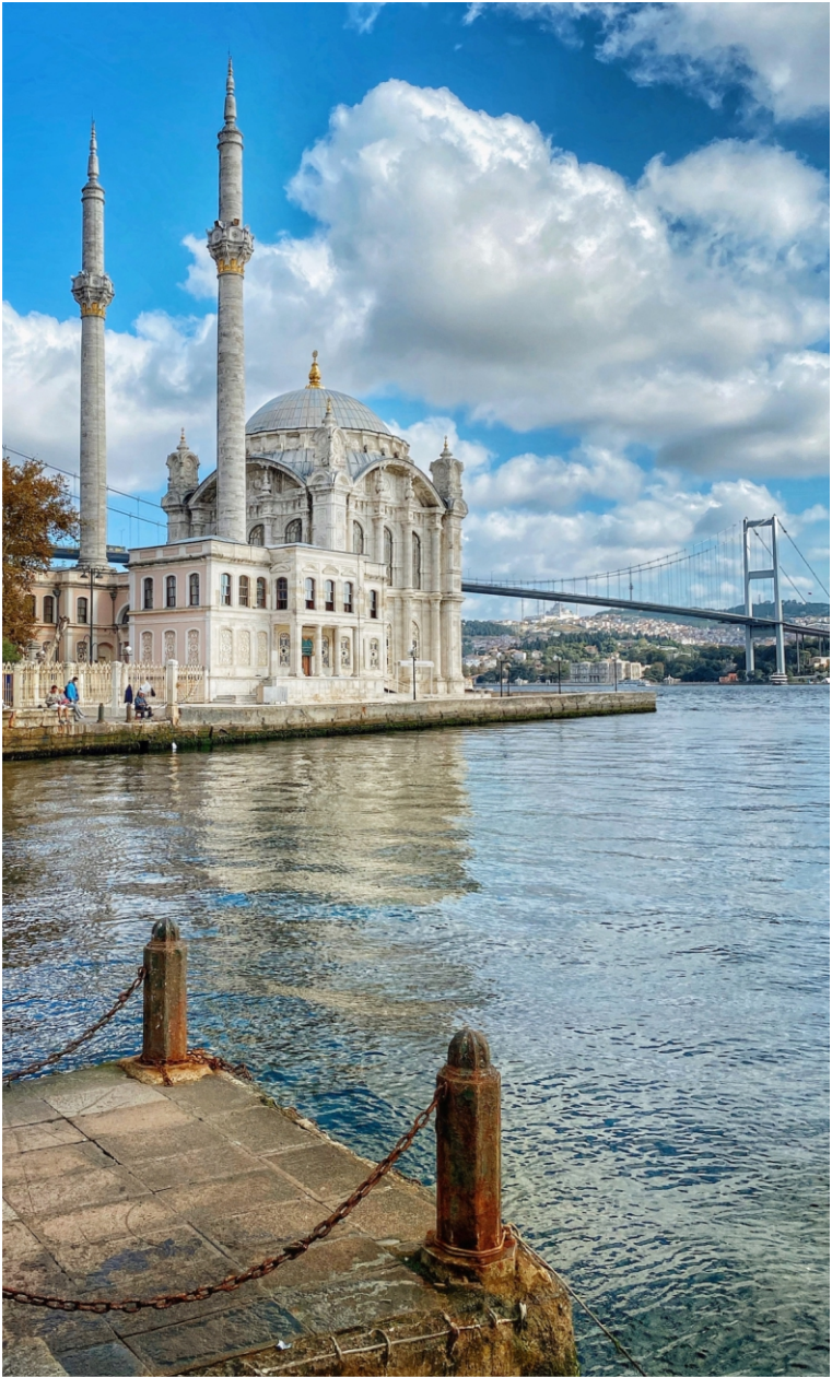
Eröncel, Banu. [ @banueröncel ], 2022

Ortaköy Mosque on the European shoreline of the Bosphorus strait, with the Bosphorus Bridge in the background.